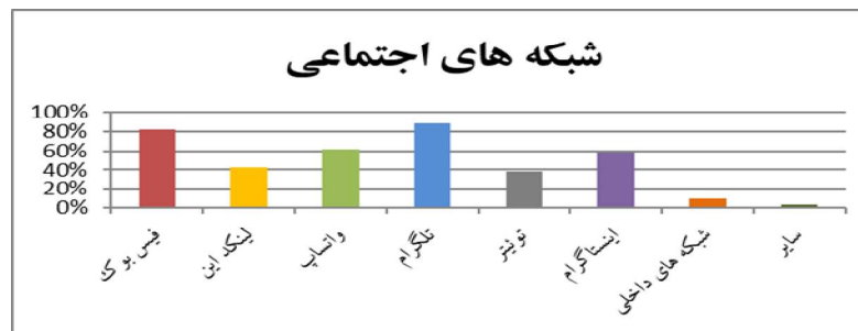
نمودار 2: درصد استفاده از شبکه‌های اجتماعی مختلف

به طور کلی، نتایج به دست آمده از پرسشنامه‌های توزیع شده، حاکی از آن است که شبکه اجتماعی تلگرام با 88 درصد، محبوب‌ترین شبکه در میان دانشجویان بوده است (نمودار 2). همچنین نتایج نشان تنها سه درصد افراد، کمتر از یک سال است که با شبکه‌های اجتماعی آشنایی دارند (جدول 2) و 44 درصد بیش از چهار ساعت در روز از این شبکه‌ها استفاده می‌کنند (جدول 3).