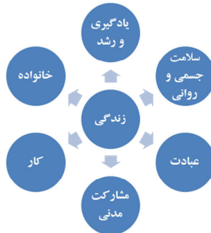
شکل 1: ابعاد اصلی زندگی انسان از دیدگاه اسلام (پیدایی و همکاران، 1392)

به دو بُعد عبادت و کار، به طور صریح در روایات مربوط به تقسیم زمان، اشاره شده است. برای مثال، امام علی (ع) می‌فرماید: مؤمن اوقات خود را به سه قسمت بخش می‌کند: زمانی که در آن با پروردگار خود به راز و نیاز می‌پردازد، زمانی که به تحصیل معاش دست می‌بازد و زمانی که به لذت‌های حلال و خوشایند می‌گذراند (محمدی ری‌شهری، 1384، ج 4: 510). درباره یادگیری، علم‌آموزی و رشد، تأکیدات دینی فراوانی داریم؛ پیامبر اکرم (ص) می‌فرماید: یا عالم باش، یا درحال آموختن دانش و وقت خود را در بیهودگی و خوشگذرانی صرف نکن (جوادی آملی، 1391: 73). امام علی (ع) در تفسیر آیه «وَلَا تَنْسَ نَصِيْبَكَ مِنَ الدِّنْيَا» 1 می‌فرماید: سلامت خود را فراموش نکن، و در تفسیر آیه «لَتَسْتَلْنَ يَوْمَئِذٍ عَنِ النَّعِيمِ» 2 می‌فرماید: نعمتی که از آن پرسیده می‌شود، سلامتی است (همان: 95). تعامل با همسایگان و دوستان، امر به معروف و نهی از منکر، توجه به نیازمندان و مشارکت در انتخابات، از وظایف اجتماعی انسان است که در بُعد کار و خانواده نمی‌گنجد. بُعد مشارکت مدنی، به این دسته از فعالیتها اشاره دارد. به بُعد خانواده نیز در آیات و روایات مربوط به حقوق والدین، همسر و فرزندان و نیز بحثهایی نظیر صلۀ رحم، تأکید و اشاره شده است.